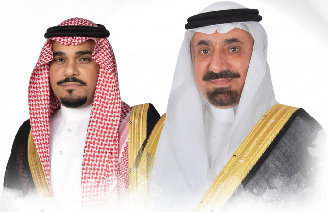
صاحب السمو الملكي الأمير تركي بن هذلول بن عبد العزيز آل سعود نائب أمير منطقة نجران